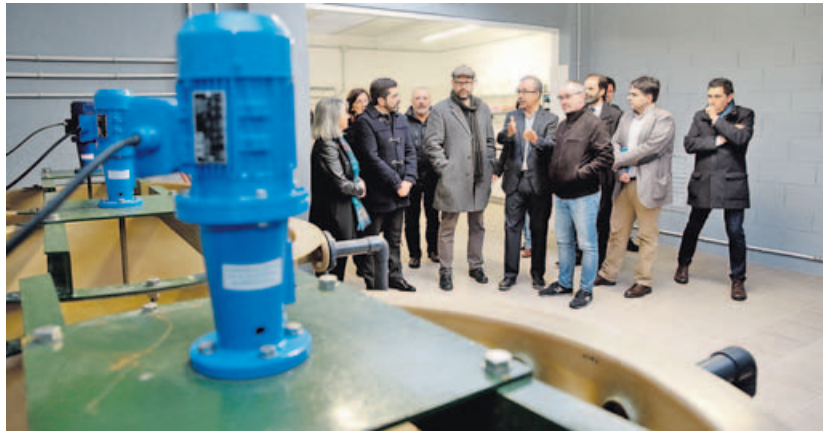
Planta de tratamiento de Ensayos de Tecnología de aguas. La planta de Silvouta acogió ayer la inauguración del laboratorio en el que se llevarán a cabo investigaciones sobre la situación de la depuración del agua en Santiago, y que tendrá capacidad para atender demanda externa. SANDRA ALONSO

El programa de Nadal para los jóvenes, organizado por las concejalías de Mocidade e Políticas Sociais, está conformado por media docena de propuestas diferentes. Se trata de Santiago Street Battles (la quinta edición del campeonato de breakdance y beatbox); Boas Noites no Nadal, con cuatro actividades previstas; Campeonato de fútbol; Cine Espallado, con diferentes sesiones de cine de barrio; muralismo (en Fontiñas); y bandas locales, con cuatro agrupaciones de Santiago.